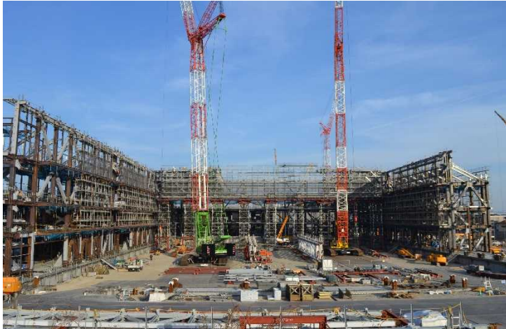
△ ① 会議・展示施設の鉄骨工事の様子

会議・展示施設では、約1万m 2 ある展示場部分の屋根鉄骨工事をを行っています。立体駐車場は鉄骨工事が完了し、床工事を進めています。