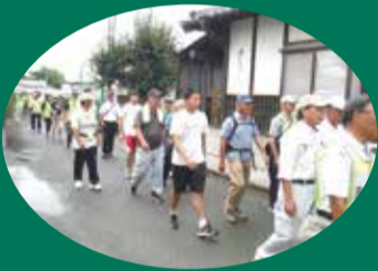
写真は平成30年9月1日に行われた県総合防災訓練の様子

水害・土砂災害の防災情報が、警戒レベルとともに提供されます。警戒レベル3・4が発令されたら速やかに避難してください。