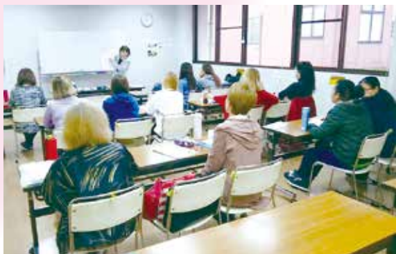
太田会場で実施した研修の様子

入門コースでは、介護の仕事に関する理解と、介護で使用する基本的な声掛け、語彙、口頭表現などの日本語を学習します。また介護記録コースでは、介護記録の作成やケアプランの理解につながる日本語の読み書き、表現などを学習します。