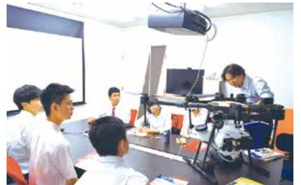
産業用ドローンの説明を熱心に聞く外国人留学生

学生からは、仕事のやりがいについて質問が出たり、企業について知ることができ、勉強になったという感想が聞かれたりしました。