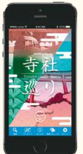
アプリ完成図（予定） ※画面は開発中のものです

今年の4～6月に開催予定の群馬デスティネーションキャンペーン（群馬DC）に合わせて、県内の代表的な寺社仏閣についてまとめたパンフレットを作成しています。3月に完成予定です。