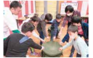
ペーゴマを楽しむ様子

餅つきやこま回しなど、家族そろって楽しめるお正月のイベントを行います。 日 1月4日(土)~13日(月) 午前10時~午後4時30分 所 ぐんまこどもの国児童会館(太田市長手町) 対 一般 ※未就学児は保護者の付き添いが必要 料 無料 申し込み方法 当日、会場に 他 詳しくは、ぐんまこどもの国児童会館ホームページ(HP参照)をご覧ください 問 ぐんまこどもの国児童会館(☎0276-25-0055)