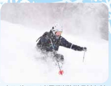
ホワイトワールド尾瀬岩鞍(片品村土出)