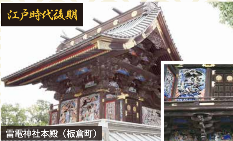
雷電神社本殿（板倉町）