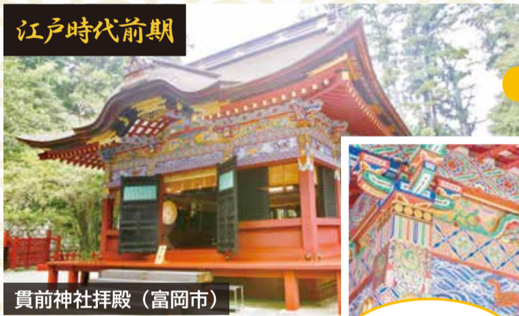
貫前神社拝殿 (富岡市)