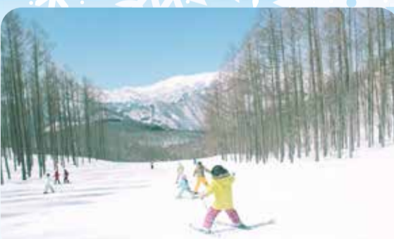
水上高原スキーリゾート(みなかみ町藤原)