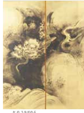
伝狩野栄信「龍虎図」(部分)