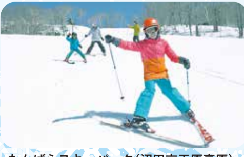
たんばらスキーパーク(沼田市玉原高原)