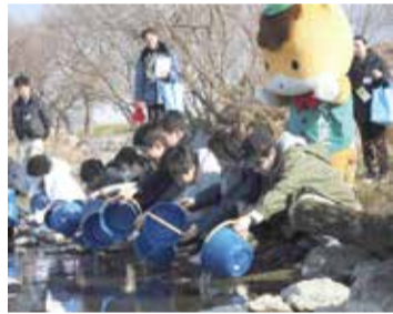
昨年の稚魚放流の様子

東京都民と一緒にヤマメの稚魚の放流や利根導水路の見学をします。 日 3月7日(土) 集合場所 利根大堰(埼玉県行田市須加) 対 県内に在住する人 ※15歳未満は保護者の付き添いが必要 定 40人圏 料 無料 受 1月20日(月)まで 申し込み方法 郵、Fまたはシ。参加者全員の郵便番号・住所・氏名(ふりがな)・生年月日・年齢・性別・電話番号をお知らせください ※1組4人まで申し込みます 他 ・雨天の場合、ヤマメの稚魚放流は中止することがあります ・自動車でお越しの場合は、集合場所付近の利根川河川敷に駐車できます 申・問 県庁地域政策課(☎371-8570 ☎027-226-2362 ☎027-243-3110)