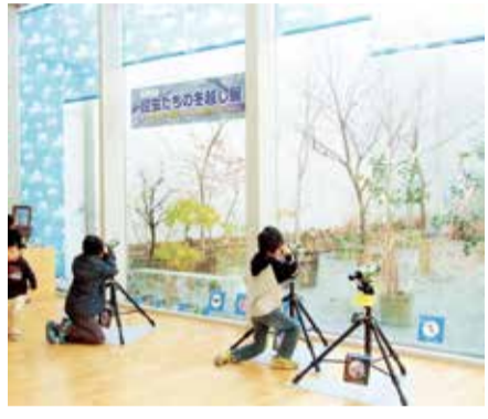
昆虫たちの冬越し展