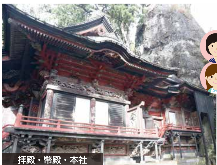
拝殿・幣殿・本社