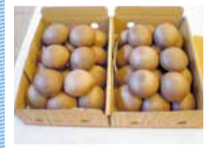
昨年度金賞を受賞したシイタケ

⑧ 県庁農政課(☎027・226・3027 ⑤027・223・3648 ⑥houseika@pref.gunma.lg.jp)