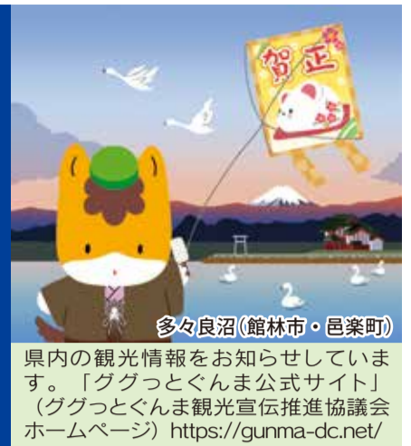
多々良沼(館林市・邑楽町)

県内の観光情報をお知らせしています。「ググっとぐんま公式サイト」(ググっとぐんま観光宣伝推進協議会ホームページ) https://gunma-dc.net/