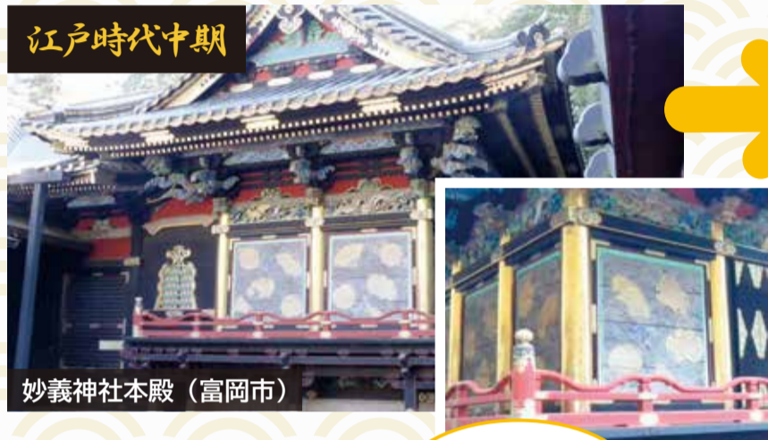
妙義神社本殿 (富岡市)