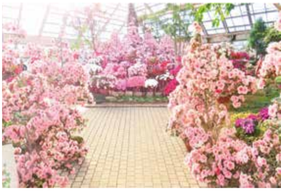
アザレアが咲き誇る温室