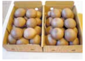
昨年度金賞を受賞したシイタケ