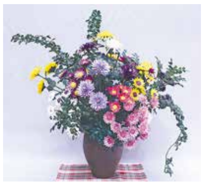
まゆクラフト「生け花 菊」 (平成30年度入賞作品)

所 県立日本絹の里(高崎市金古町) 観覧料 一般1200円、大学・高校生1000円、中学生以下1100円 問 027・360・6300