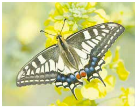
キアゲハとナノハナ

※入園料がかかります 入園料 一般410円、大学・高校生200円、中学生以下1100円 問 0277・74・6441