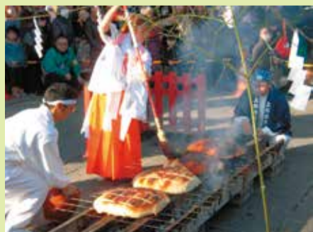
巨大なまんじゅうに、みそだれをはけで塗る様子

祭りでは、直径55センチのまんじゅう4個に、長さ約3層の竹串を刺して炭火で焼き上げます。表面がこんがり焼けると、巫女姿の伊勢崎市観光大使「ミスひまわり」の2人が、巨大なはけで豪快に甘いみそだれを塗り、焼きまんじゅうが完成。境内には香ばしい匂いが漂いました。