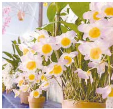
デンドロビウム・ファーマリ

※入園料がかかります 入園料 一般610円、中学生以下1100円 問 0120・1187・38