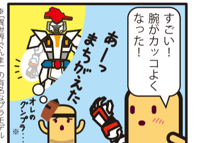
※「異世界ぐんま」の有名キャラクター