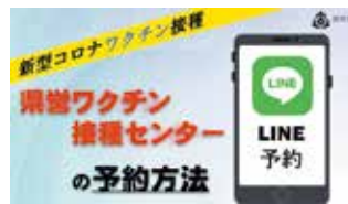
LINEでの予約方法を動画で紹介

市町村が実施するワクチン接種の予約や会場などの詳細は、住所地の市町村ホームページや広報紙などを確認してください。なお、県営ワクチン接種センター(東毛・県央)でも接種できます。9月5日以降の県央ワクチン接種センターでの新規予約は、2回目の接種会場が異なりますのでご注意ください。予約はLINEから受け付けています。