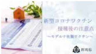
接種後の注意点を動画で紹介

主な副反応として接種部位の痛みやだるさ、発熱などがありますが、そのほとんどは、数日以内に回復します。数日たっても体調が悪い、痛み・腫れが取れないなどの症状がある場合は、ぐんまコロナワクチンダイヤル(☎0570-783-910 通話料がかかります)にお問合わせください。