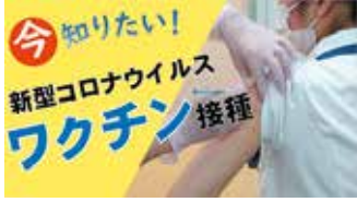
ワクチンの情報を動画で紹介

接種による効果と副反応のリスクを理解していただいた上で、 積極的なワクチン接種をお願いします。