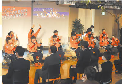
オンラインで参加する高校生に手を振る受賞者たち

東京2020オリンピックで13年越し、2大会連続の金メダルを獲得したソフトボール日本代表の県関係者13人に対する県民栄誉賞顕彰式を昨年11月、県庁32階官民共創スペース「NETSUGEN」で開催しました。受賞は2018年に全国高校サッカー選手権で初優勝した前橋育英高校サッカー部以来、7例目です。