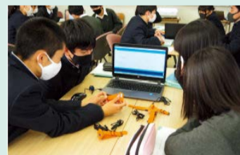
昨年度の活動(歩数計を用いた健康探究)