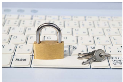
パスワードは複雑にしましょう