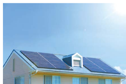
台風や雷による破損も報告が必要です

問 経済産業省(☎03-3501-1511)、県庁気候変動対策課(☎027-897-2752)