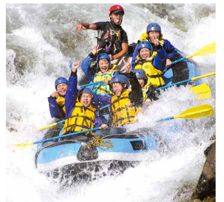
群馬県をリトリートの聖地に