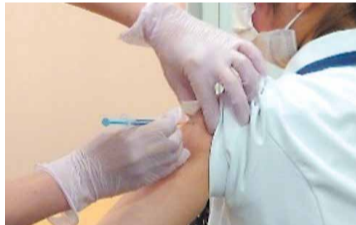
ワクチン追加接種の円滑な実施

感染の急拡大に十分対応できるよう、引き続き病床の確保に取り組む他、相談・検査体制の充実により感染拡大を防止します。また医療機関への支援やシステムの整備、県営ワクチン接種センター運営など、市町村と連携してワクチン接種を効果的に推進します。