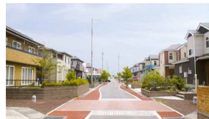
きれいに整備された、ふれあいタウンちよだ

申込用紙配布場所・問 ふれあいタウンちよだ現地案内所(☎0276-86-7500)、県庁団地課(☎027-226-3955)