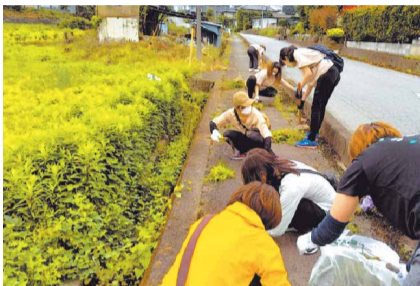
花緑の植栽や除草で美しい街へ