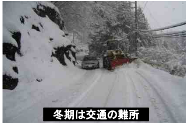
冬期は交通の難所