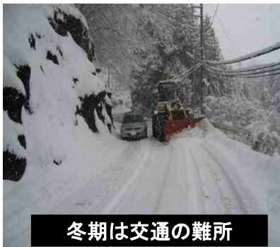
冬期は交通の難所