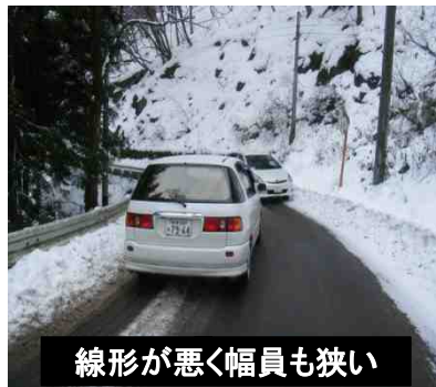
線形が悪く幅員も狭い