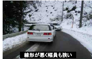
線形が悪く幅員も狭い