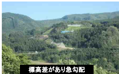
標高差があり急勾配

起終点の標高差や道路線形が悪く幅員も狭いうえ、特に冬期間は交通の難所となっている。また、望郷ラインの中で本区間のみが未完成となっている。沼田市、片品村地域の主要な観光地ルートとして位置付けられており、事業の目的および必要性について変化はない。