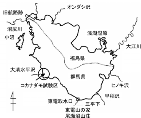
図1 尾瀬沼コカナダモ試験区位置図