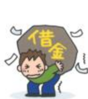
借金をする 周囲の信頼を失う