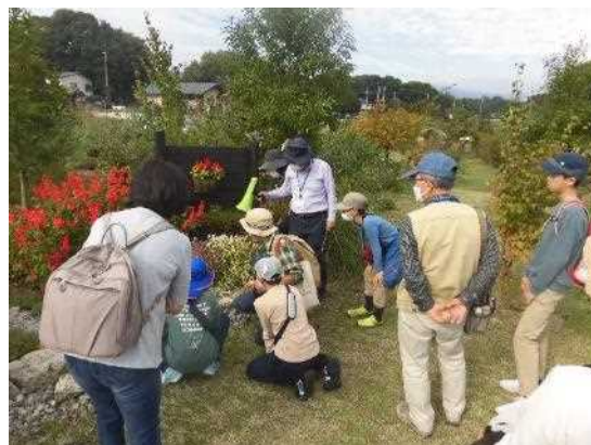
ガーデンの様子を説明

第一回（10月15日）は生きものたちを呼ぶ庭づくりをテーマにした。この回は生物多様性の意義を学び、地球規模で進行しつつある生物種の大量絶滅について考えることを目的とした。生物多様性を維持するためには“遺伝子の多様性”、“種の多様性”、“生物の生活する環境の多様性”を守る必要がある。例えば同じ生物種でも多様な遺伝子を持つことにより病気や環境の変化に有利になる。この中でガーデンにあるハシバミやウグイスカグラを例にし、これらの植物は自家受粉を避け、自ら遺伝子の多様性を守る仕組みがあることを話した。