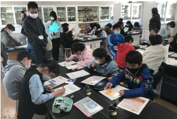
(R5. 2. 14 安中市立原市小学校)

「ひとりひとりができること、ちょっと関心を持って行動すれば、きっと素敵な未来が訪れる」そんな思いを込めて、群馬県のホームページには様々なお役立ちページ&リンクをご用意しています。また、温暖化・エネルギー部会より関連した外部リンクを紹介していただきました。ぜひご覧いただき、ご興味をお持ちいただけましたら幸いです。