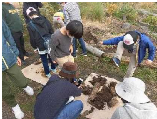
キノコによって朽ちた木を踏んで土に戻す