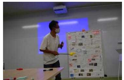
環境ワークショップでの発表