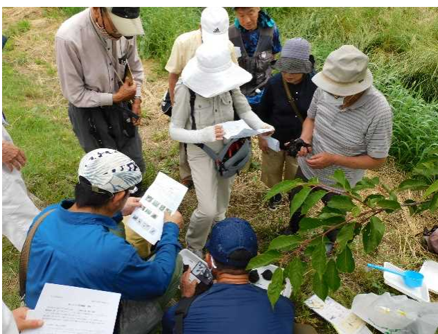
桃ノ木川の観察会

アカバナユウゲショウ、アレチウリ、イタチハギ、イモカタバミ、オオブタクサ、コセンダングサ、ククイモ、コツマヨイクサ、シロツメクサ、シバンモロコシ、ゼニアオイ、ヒメジョオン、ビロードモウズイカ、マメグンバイナズナ、ムラサキツユクサ、ヨウシュウヤマゴボウ等が観察されました。