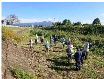
いきもの観察会を楽しむ人々