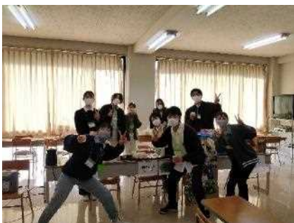
環境活動に励む若人