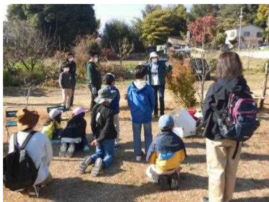
ソーラークッカーの説明

2回の学習は比較的高度な内容を含むものもあったが、子供たちは真剣に取り組んでくれた。この学習において子供たちは環境に対して驚くほど高い関心を持つことを知った。私たちは若い世代に美しい環境を残すため一層の努力が必要なことを痛感した。