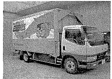
エコムーブ号本体です