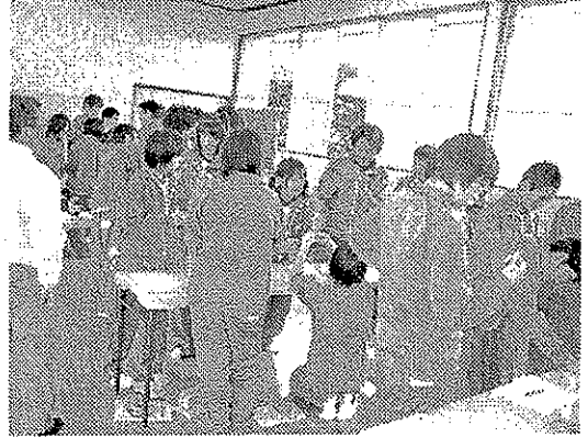
パックテストによる水質実験の様子