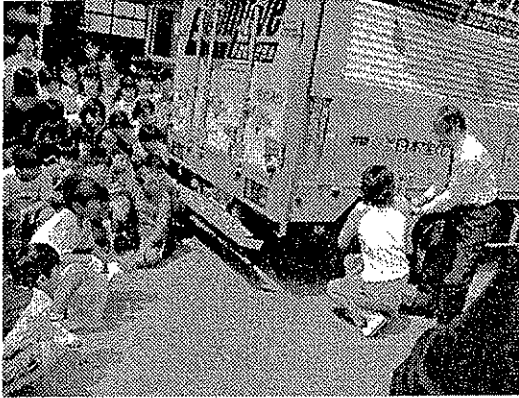
排気ガス実験の様子

県では、エコムーブ号に搭載されている展示品や、実験器具を使って県に登録されたサポート一が、学校などで環境教室をおこなう「動く環境教室」を実施しています。