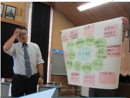
中之条町の、地域と学校の「つながりの強さ」を生かした、「キャリア教育」の取組の発表。

研修会の後半は、各町村の教職員・PTA・教委職員でグループワークを行い、それぞれの地域の特色を生かした、学校・家庭・地域が連携した「地域学校協働活動」について話し合われました。