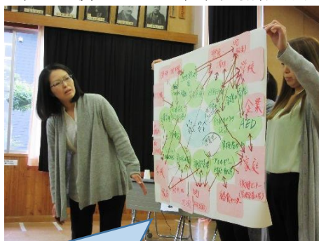
草津町の、関係機関の「つながり」や「協働」を工夫した、「安心・安全」の取組の発表。