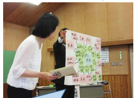
長野原町の、地域と学校が「協働」して行う、「郷土の人材を生かした学び」の取組の発表。