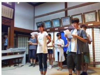
ふるさと夕涼み会クラブ発表