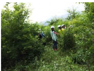
新宿の森の下草刈り