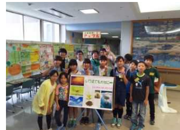
ぬまた環境フェスティバルにブース参画