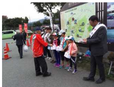
赤い羽根共同募金活動のお手伝い