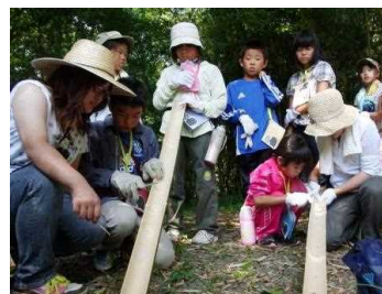
流しそうめん台作り