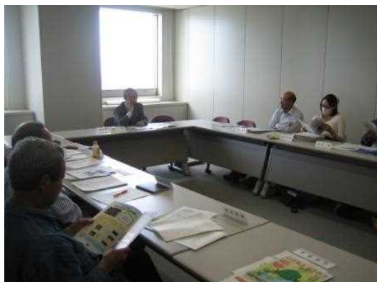
第1回 運営委員会の様子