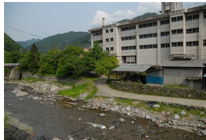
○南牧中学校のうら ←南牧川 石の裏に 水生生物発見! ↓