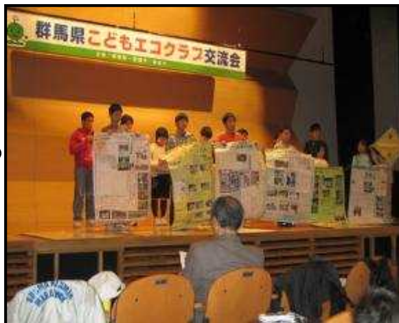
〈昨年度の交流会の様子より〉

《活動発表クラブ》(予定) 高崎北小エコクラブ 地球防衛隊 前橋市児童文化センター環境冒険隊 Earth Angels 元総社エコクラブわんぱく探検隊 緑の少年団