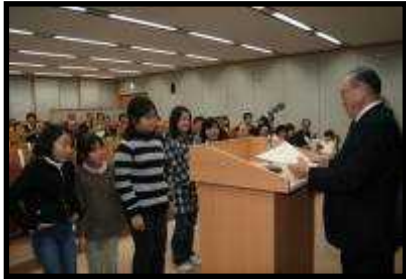
表彰式の様子です

群馬県では52件の応募があり、しらさわエコキッズクラブの、「地域における環境教育活動」が、優秀賞に選ばれました。「ポイ捨て禁止カンバン」作成・設置などの地域に根ざした活動は、素晴らしいですね。