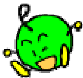
エコまるジャンプ

ご存じですか?群馬県では、地球温暖化防止について身近に考えていただくために、平成15年度から「ゆうまちゃんの県民エコDo!」を実施しています。もちろん、今年度も実施していきます。エコクラブ単位での参加も大歓迎です!たくさんの参加をお待ちしています!!