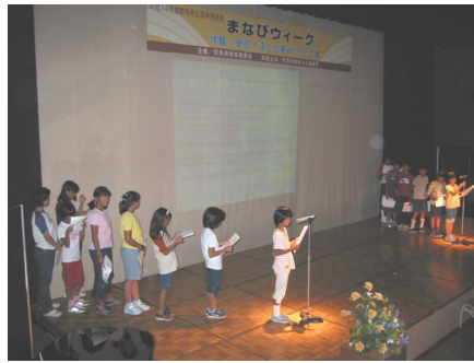
（しらさわ：全員で活動発表）