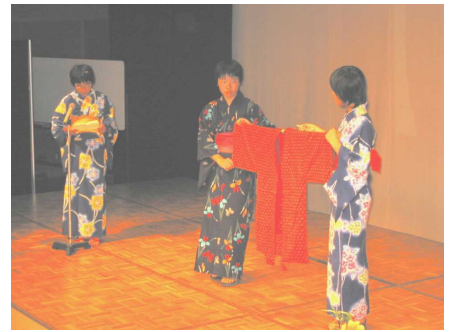
（ヤマメ：和裁について発表）

上記3クラブに限らず、今年度の各クラブの活動も本格的になってきていると思います。これから秋にかけて、活動のしやすい時期となります。JECニュースなどを参考に、トレーニングやアクションに積極的に取り組んでいきましょう！