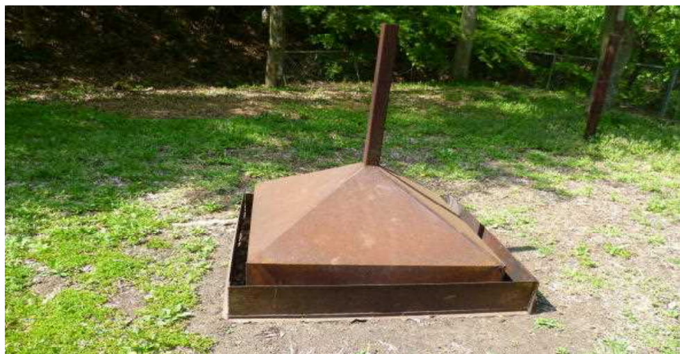
清掃後の煙突フードと風除け鉄柵