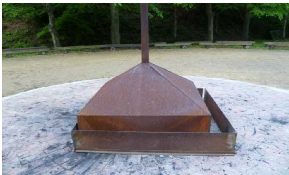
煙突フード 風除け鉄柵