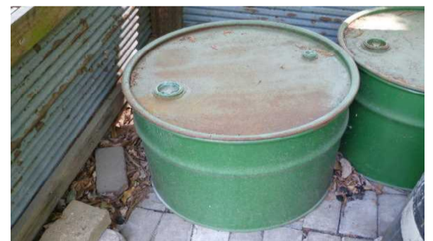
灰を入れるドラム缶