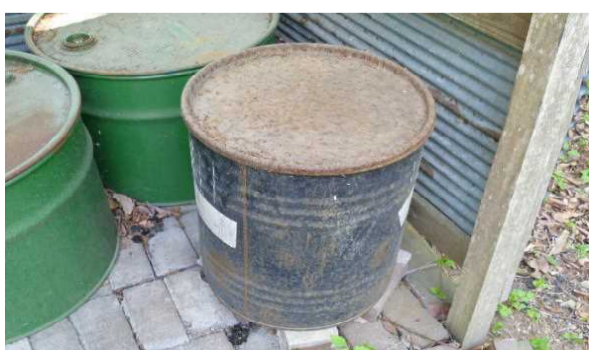
残った薪入れるドラム缶