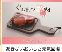
第2弾 ぐんまの豚肉