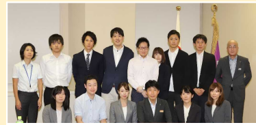
知事と若手医師等との意見交換会