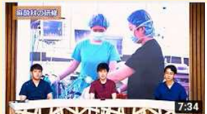
ぐんまの臨床研修病院紹介動画