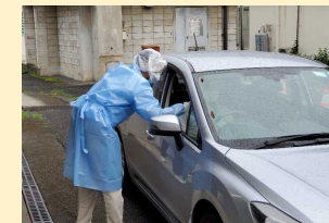
PCR検査センターでのドライブスルー方式の検体採取