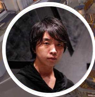
落合 陽一 氏