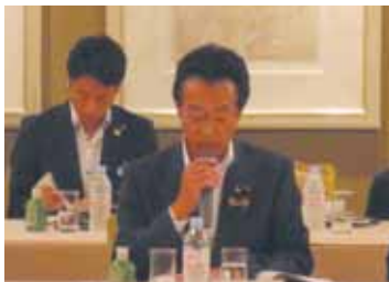
提案の趣旨説明の様子

会議では、地方財政制度や教育予算など国の施策に関する要望事項を協議しました。本県議会から提案した子ども医療費助成に係る国庫負担制度の改善など10項目を採択し、国会や各省庁に要望しました。