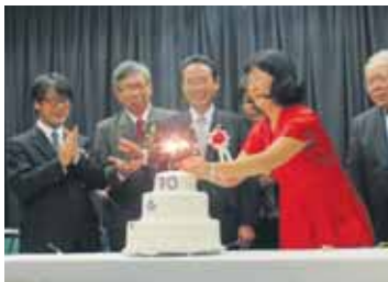
在伯群馬県人文化協会創立70周年記念式典祝賀会にて

在伯群馬県人文化協会より、在伯群馬県人文化協会創立70周年記念式典及びサンパウロ州群馬県姉妹提携35周年記念式典への招待が岩井均県議会議長にあり、8月に出席しました。また、長年にわたる移住関係者の労苦と功績を称えとともに在外県人会との交流を図るため、南加群馬県人会(アメリカ合衆国口サンゼルス市)の訪問も併せて行いました。