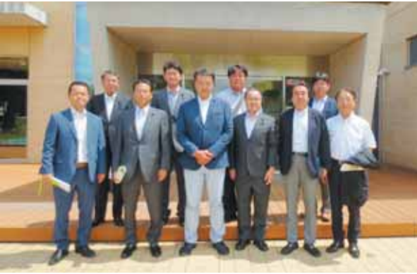
前橋市児童文化センターにて