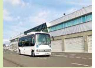
自動運転の実証実験車両(群馬大学所有)