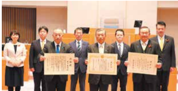
受賞した8名の議員

12月14日、在職30年以上の議員と10年以上の議員に対して、全国都道府県議会議長会表彰状の伝達が行われました。また、議会から顕彰状が授与され、知事から感謝状が贈呈されました。