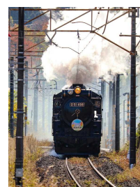
「湯けむりフォーラム」 gaku224さん