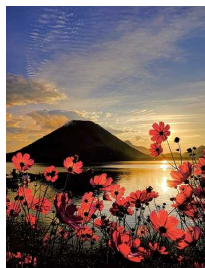
「ぐんまの風景・食べもの」 「秋の気配」 shinopapa527さん

(参考)【昨年度の「ぐんま応援びと」各テーマ第1位作品】(上段：テーマ名、中段：タイトル名、下段：投稿者名)