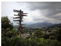
「ガンマー帝国内部レポート」 「ぐんまの標識」 kuroku_magamgasさん