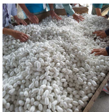
「絹の国ぐんま大発見」 「晩秋蚕繭 荷受け」 tkhs708さん