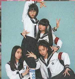
新しい学校のリーダーズ