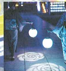
NAKED ディスタンス提灯®