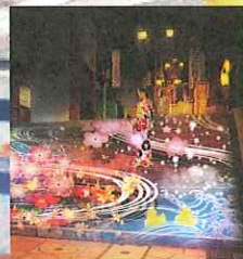
伊香保アート階段