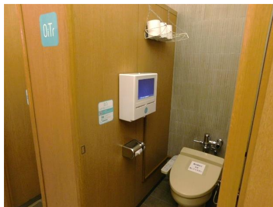
自然史博物館1階女子トイレ