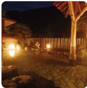
県内温泉のイメージ

チャレンジ期間中に無事故・無違反を達成して報告すると、抽選で合計220チームに特別賞が当たります。