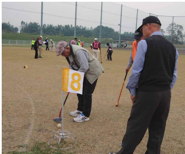
グラウンドゴルフや輪投げ大会などを行っている