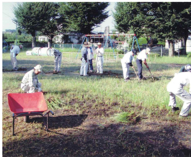
活動の一つである公園の除草作業