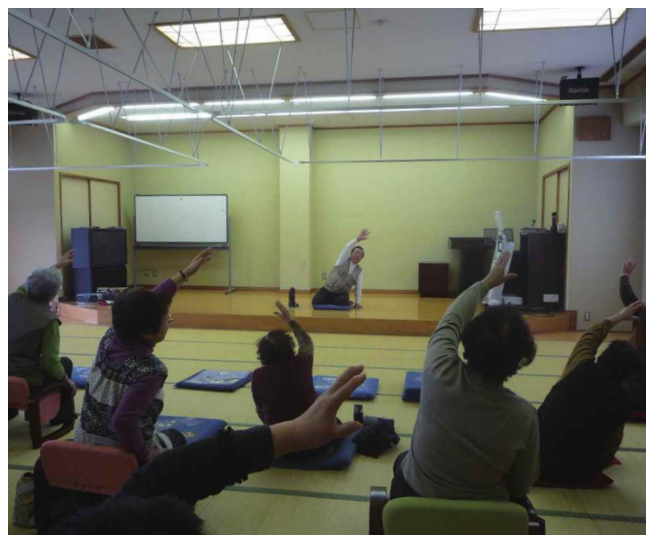
参加者の前でお手本を見せる介護予防サポーター