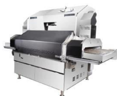
加熱機器（SVロースター）

取引製品 洗浄システム機器、炊飯システム機器、消毒保管機器、調理・加熱機器ほか 本社 大阪府大阪市生野区巽南五丁目4番14号 県内拠点 群馬県伊勢崎市東上之宮町1633 資本金 14億4,560万円 従業員数 645名（令和3年6月現在）