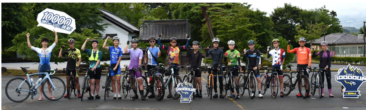
(令和5年7月に開催した第1回10,000UPチャレンジDayの様子)