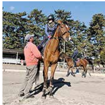
インストラクターが丁寧にサポートします