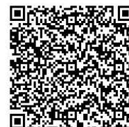
Para la inscripción acceda desde aquí