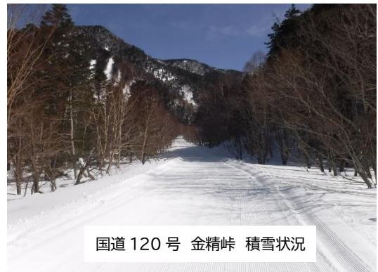
国道 120 号 金精峠 積雪状況