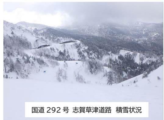
国道 292 号 志賀草津道路 積雪状況