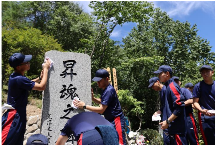
令和5年8月3日 御巢鷹の尾根郊外研修