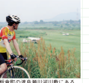
板倉町の渡良瀬川河川敷にあるグライダー滑空場