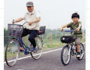
いつもの自転車で気軽に楽しむ