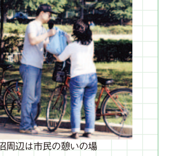
城沼周辺は市民の憩いの場