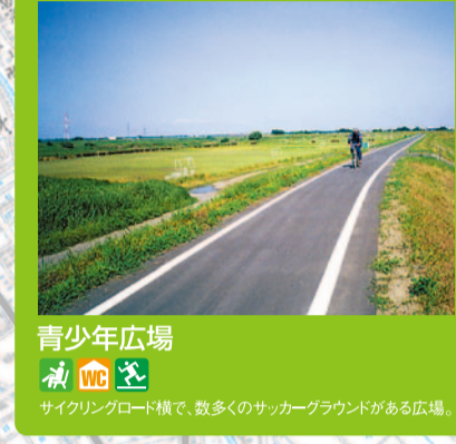
青少年広場 サイクリングロードで、数多くのサッカーグラウンドがある広場。