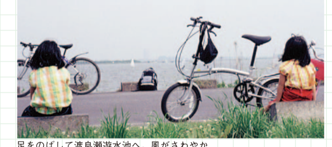
足をのびして渡良瀬遊水池へ。風がさわやか