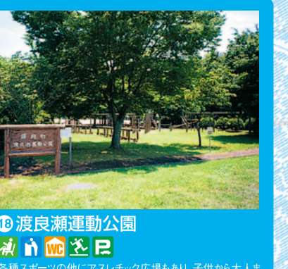
渡良瀬運動公園 各種スポーツの他にアスレチック広場もあり、子供から大人まで楽しめる運動広場。一部有料。

course guide ● 渡良瀬川をのんびり自転車で下ってみよう。 桐生足利藤岡自転車道