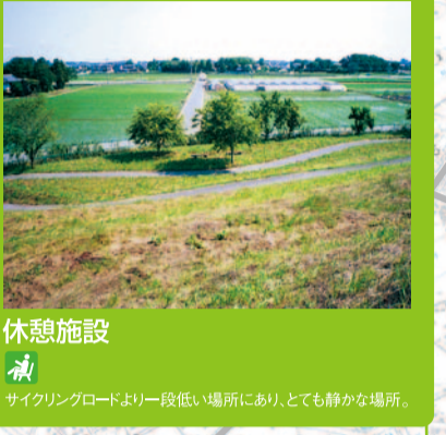
休憩施設 サイクリングロードより一段低い場所にあるため、とても静かな場所。