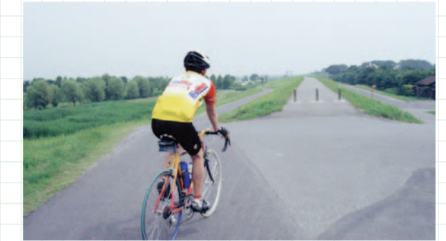
どこまでも続く一本道を水と緑の美しさを感じながらペダルを踏む

course guide ● 渡良瀬川をのんびり自転車で下ってみよう。 桐生足利藤岡自転車道