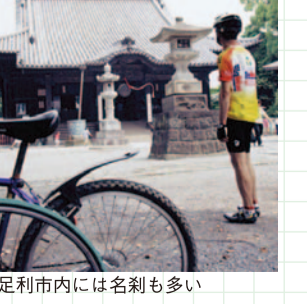
足利市内には名刹も多い