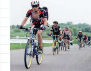
ツーリングを楽しむ本格派