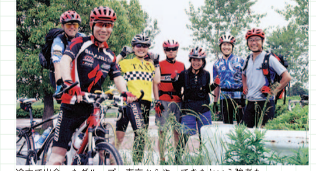
途中で出会ったグループ。東京からやってきたという強者も

ゆったりペダルを踏むと時速15km。心もち速み込むともう時速20kmだ。全身に風を感じる。子供の頃、下り坂を全速ですべり下った懐かしい心地よさを皮膚が思い出す。風が土手に茂る草の香りを運んでくる。水辺の空気を運んでくる。なんて気持ちいいだろう。眼下には渡良瀬川が流れる。桐生を出発したときには水を追いかけけるようにペダルを踏んだ。が、いつのまにか太くゆつたりとした流れを自転車が追いつく。目の前に渡良瀬遊水池が広がった。何をやるにも自分がいい。自転車もそうだ。身の丈にあった自転車のペダルを気分よく踏めればいい。ここにはそんな人たちが集まってくる。見ず知らずの人と笑顔で並走し「それじゃあ」の一言で別れる。全区間走ってもいいし一部でもいい。それもまた自由だ。