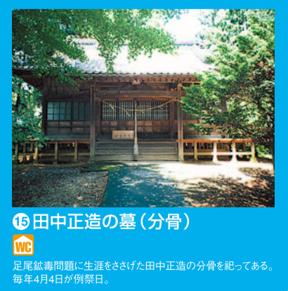
19 田中正造の墓(分骨) 田中正造の遺骨が分骨された田中正造の墓。毎年4月4日が滑空祭。