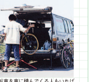
自転車を車に積んでくれる人もいれば現地レンタルして楽しむ人もいる