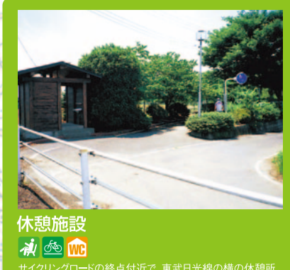
休憩施設 サイクリングロードの終点付近で、東武日光線の橋の休憩所。