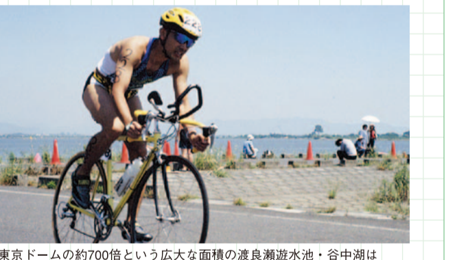
東京ドームの約700倍という広大な面積の渡良瀬遊水池・谷中湖はサイクリングのメッカ。毎年トライアスロン大会も開かれている