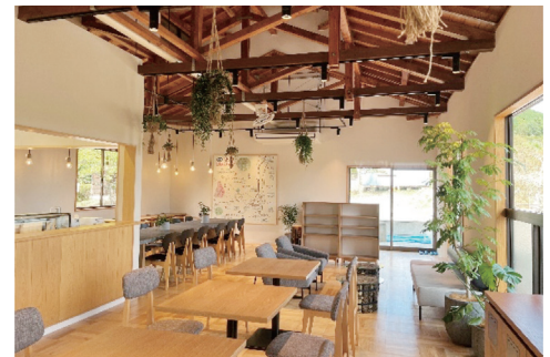
リノベーション生まれ変わった内装。 左奥のテーブルは鬼石特産の石材を使用

取材に当たっては、藤岡市にぎわい観光課の皆様には大変お世話になりました、ありがとうございました。