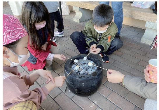
TTT(仮)のイベントの様子

また、策定までの取組みは逐次、街なか通信「かたりば」に取りまとめ、基本計画と併せて下仁田町ホームページで公開しています。