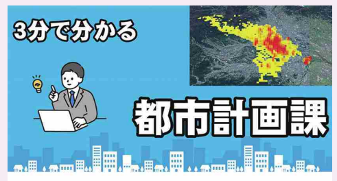
動画サムネイル：3分でわかる都市計画課

出展：群馬県公式YouTubeチャンネル tsulunos より 3分でわかる都市計画課