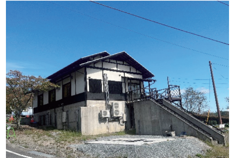
シェアカフェに改装した休憩棟外観

桜山公園は、藤岡市三波川にある標高591mの“桜山”の頂上にあり、藤岡市を代表する観光地です。シンボルは11月中旬～12月上旬に見頃を迎える国指定名勝及び天然記念物の冬桜。また、47haの広大な園内には他にも早春のロウバイや梅等花々が咲き、特に桜は“日本さくら名所100選”にも選ばれています。その第一駐車場近くの床面積99㎡の木造平屋建ての休憩棟を、「無印良品」などを展開する(株)良品計画(東京都)と提携し内装デザインや活用方法を検討・改装して新たに希望者に貸し出しできるシェアカフェとして10月29日(日)にオープンするとの事で、オープン前でお忙しい10月頭にま～ちいずで現地に取材してきました!