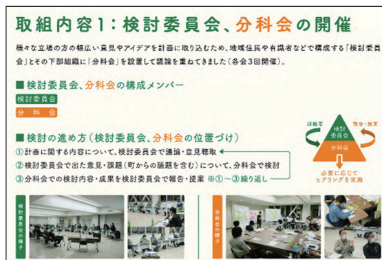
基本計画より 検討委員会・分科会の進め方

検討委員会や分科会の合間にも、下仁田高校でのワークショップや、街なかで暮らしている方々を個別訪問してヒアリングを実施し、様々な立場の方に策定に関わっていただきました。