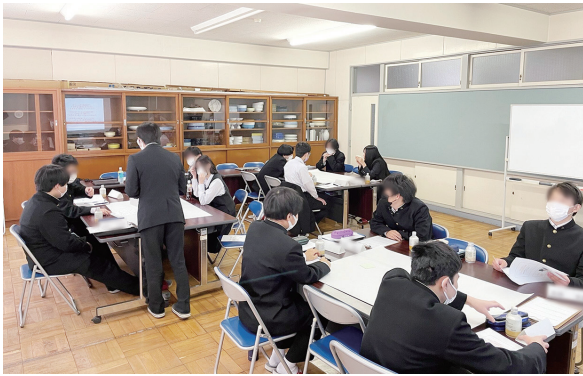
「未来を描くワークショップin下仁田高校」の様子

群馬県官民連携まちづくりプロジェクトチームにも、進め方についてアドバイスをいただき、幅広い層からの意見を取り入れることができました。