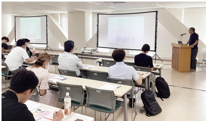
まちづくり講演会の様子