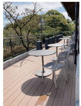
テラスはカウンターも設置でき、実際座ると高原リゾート感が凄かったです!