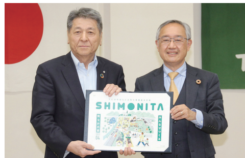
基本計画の完成受け渡しを行う原町長(左)と熊倉委員長

下仁田町では持続可能なまちづくりに向けて、町の中心地域の活性化により商業振興や地域の活性化へつなげ、ひいては全町民へ経済的・社会福祉的な波及を図るために、「下仁田町街なか活性化事業基本計画(以下、基本計画)」を策定しました。現在は、基本計画の具現化に向けて事業の検討を進めています。