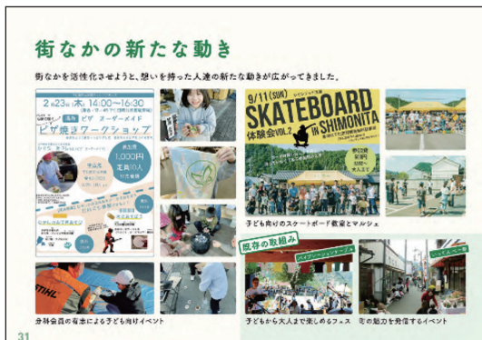
基本計画より 街なかの新たな動き

これからも町民、事業者、教育機関、行政などの地域に関わる人々で連携し、みんなが“ワクワク”する下仁田町に向けて取り組んでいきます。