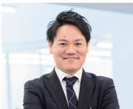
共愛学園前橋国際大学 国際社会学部学部長