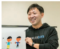
サンダーバード株式会社 代表取締役