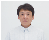
群馬大学大学院理工学府 知能機械創製部門助教