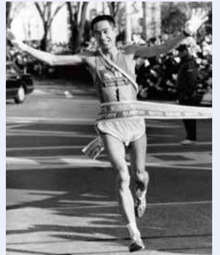
群馬で開催された最初のニューイヤー駅伝の優勝はエスビー食品

昭和63年「ニューイヤー駅伝」の通称で実業団の駅伝日本一決定戦がテレビで生中継されるようになりました。この年から12月第3週に開催されていた大会が元日開催になり、世界で1番早く行われる大会として注目を集めました。県庁(前橋市)をスタートし、高崎市、玉村町、伊勢崎市、太田市、みどり市、桐生市を回り県庁に戻ってくる7区間100kmのコースは、実業団駅伝の魅力を保つとともに、群馬の魅力も伝えてくれます。