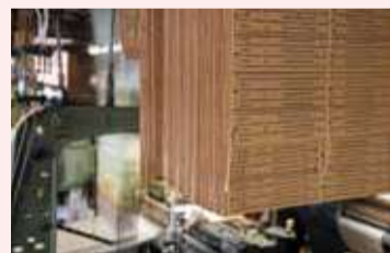
ジャカード織機は緯糸1本につき1枚の紋紙を使い、複雑な模様を織り上げる