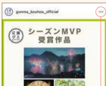
「お気に入り」の追加はこちらから

Instagramのホーム画面にはフォロー中のアカウントの他、自動で「おすすめ」の投稿が表示されます。「見たい投稿」を増やすには「いいね！」「閲覧時間を増やす」他、「お気に入りに追加する」方法などがあります。