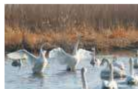
多々良沼西側のガバ沼の白鳥

多々良沼では西側のガバ沼を中心に、3月上旬まで観察できます。最も多く観察できるのは1月下旬～2月上旬。毎年1月には「白鳥まつり」が行われます