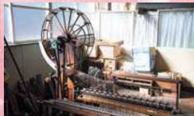
強撚糸を作る「八丁撚糸機」は江戸時代に桐生で考案された。水力を動力にして効率的に撚糸ができる

糸をねじり合わせる。生糸を束にして撚糸をすることで丈夫な糸になる。撚りの回数が多い「強撚糸」は凸凹状のシボ(シワ)が生まれる。桐生織の「お召織」は緯糸に強撚糸を使って作られる