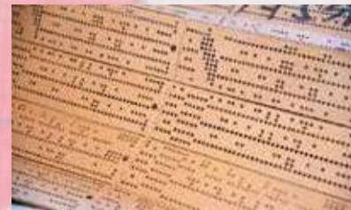
ジャカード織機は紋紙(パンチカード)の穴の並びによって自動制御されている

織機とは布を織る機械のこと。手織機と力織機がある。明治時代、桐生は力織機の1つで、複雑な文様を織り出せるジャカード織機を導入することで近代的な生産体制を構築した