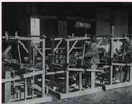
明治から昭和初期にかけて「伊勢崎銘仙」の生産量の増加に伴い、工業化が大きく進んだ

日本書紀に織物を献上した記述があるほど、歴史の古い伊勢崎の絹織物。江戸時代には商品化が進み、明治に入ると絣の生産を分業したことで品質を格段に向上させました。そのため伊勢崎絣は“銘仙”と呼ばれるようになり、全国の銘仙生産量の約半分を占め、戦後は復興の主要産業として、さらに売り上げを伸ばしました。