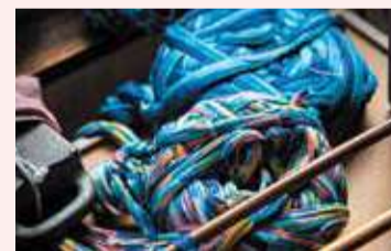
伊勢崎絣の独特の柄を作り出す「括り絣」で染められた色鮮やかな絹糸