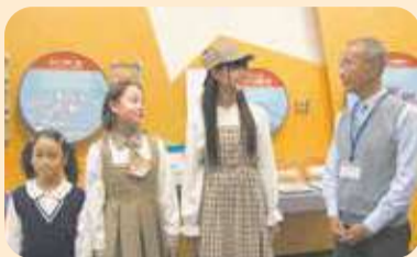
絹がどうやってできるか説明を受ける探偵団