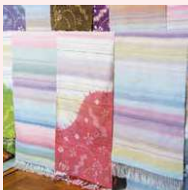
淡い色使いが洋服にも合う伊勢崎絣のストール。絹100%でも洗濯機で洗える気軽さも好評

現在は事実上、技術が途絶えてしまっている伊勢崎絣。そんな中、伝統ある絣技術を未来に残すため、学校で子どもたちに向けてワークショップを行ったり、日用品としても商品化したりするなど、伊勢崎絣の伝統を残す活動が行われています。素朴でありながら色鮮やかな伊勢崎絣は、絹織物を身近に感じる品として、現在も生き続けています。