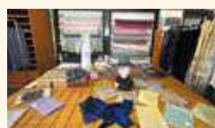
販売場では手軽に桐生織が購入できる

1300年余りの歴史を持つ桐生織の貴重な資料や機械類を展示しています。建物は国の登録有形文化財に指定されています。