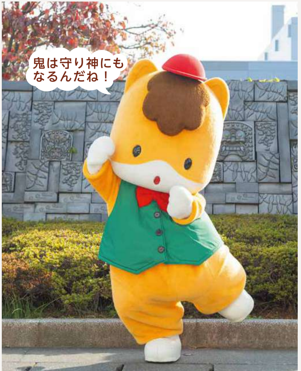
▲藤岡市立図書館前の鬼面瓦