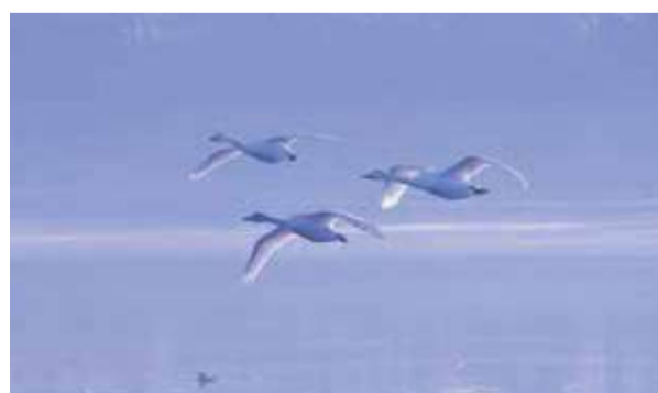
朝もやの多々良沼を飛び立つ白鳥(邑楽町)

“冬の旅人”として日本各地に飛来する白鳥。日本には越冬のために飛来し、春になるとシベリアに戻ります。県内では館林市と邑楽町にまたがる多々良沼などで観察できます。白鳥の中でも多々良沼に飛来するのは主にコハクチョウ。成鳥は白で、幼鳥は灰色。幼鳥は夏にシベリアで生まれてから大人と一緒に日本に飛んできます。