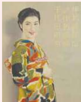
昭和初期の有名俳優を起用した“銘仙ポスター”