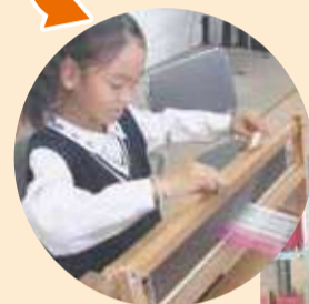
絹糸を使って手織りコースター作りを体験。2時間くらいでできます