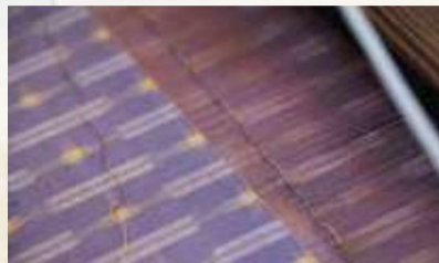
経糸はあらかじめ織機に配置しておく。緯糸は杼(板杼)に巻き付けて、上下に分かれた経糸に通す

織機の縦方向に張るのが経糸、横方向に入れるのが緯糸。経糸と緯糸を交互に浮き沈みさせて織るのが「平織り」。経糸、緯糸の糸の質や撚りの強さ、太さの違いを組み合わせて、さまざまな織物ができる