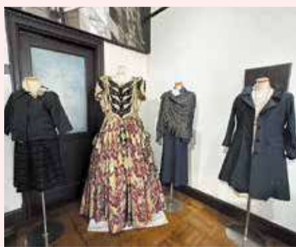
桐生織の生地で作られた洋服やドレス

伝統的な技法で着物や帯を作り続ける一方、新しい物作りにも取り組んでいます。桐生織の技術を基に、最新技術や素材を取り入れ「桐生テキスタイル」として新しい生地を開発し、国内外のファッション業界の需要に応えています。