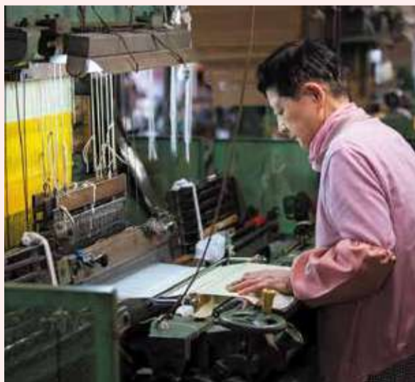
かつて多くの工女が支えてきた桐生の織物工場。時代が変わっても、その技術は今も多くの人たちに受け継がれている

古くから絹織物業が栄えていた桐生には、京都、近江など各地の職人が多く行き交い、それぞれの土地で発展した技術を持ち込んだことで、さらに繁栄していききました。その高い技術が認められ「お召織」など7つの技法が国の伝統的工芸品にも指定されています。中でも、紋紙によって自動制御されるジャカード織は、その複雑な文様を織り出す技術力が高く評価されています。