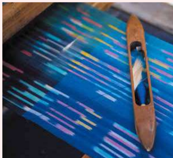
経糸と緯糸を1本ずつ合わせながら織る「平織」から生み出される伊勢崎絣は国の伝統的工芸品に指定されている

経糸も緯糸も、糸の段階で先に色を染め、柄合わせをしながら絣模様を織り出す伊勢崎絣。元々「絣」は柄を表す言葉ですが、伊勢崎絣はこの絣模様を生かした「織物」のことを指します。その特徴は伊勢崎絣独自の「併用絣」に代表される染めや織りの技法。製造工程は10以上に分類され、それぞれの職人が自分の技術を極めたことで、質の高い織物を生み出してきました。