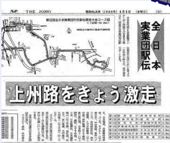
昭和63年(1988年)1月1日付 上毛新聞