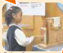
座繰り器で繭から糸を取り出すのか～