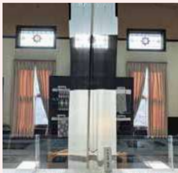
鎌倉幕府討幕時の新田軍の中黒古旗(複製)