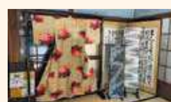
さまざまな企画展を開催

季節に合わせた伊勢崎銘仙を常設展示しており、銘仙の生地を使用した手作りのアクセサリーやお土産も販売しています。