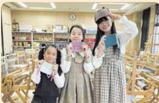
みんな上手にできました！