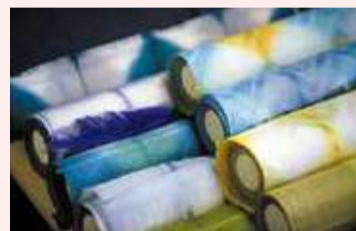
身につけたときの所作で文様の光沢が表れて生地表情が変化する